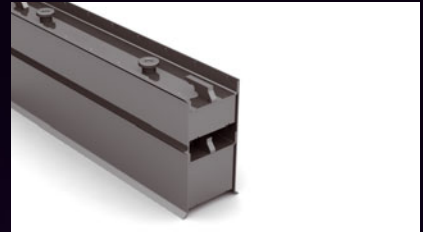
M-BASIS / M-TOP-SERIE

Schalungen für Massiv- und Sandwichelemente, Decken und Fassaden in Standardstärken.